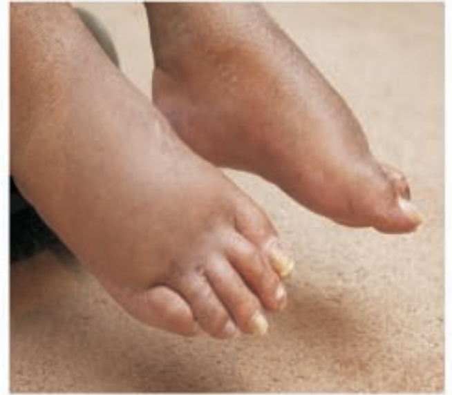
ಎಡಿಮಾ (ಕಾಲುಗಳಲ್ಲಿ ನೀರು ತುಂಬುವಿಕೆ)