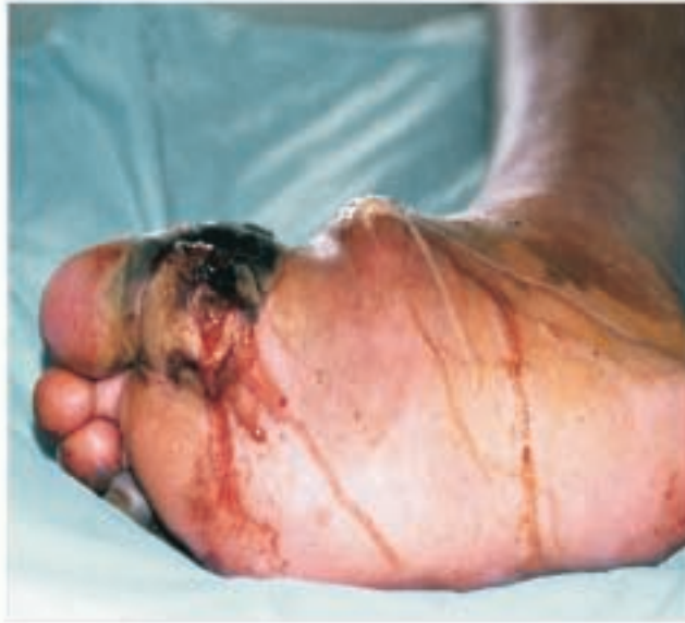
ಕಾಲನ ಸೋಂಕು ರೋಗ