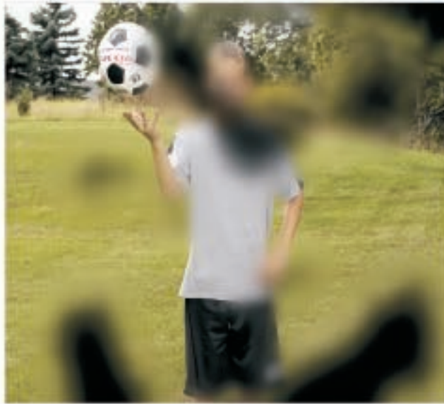
ಅಪೂರ್ಣ ಅಥವಾ ಪೂರ್ಣ ಅಂಧತ್ವ